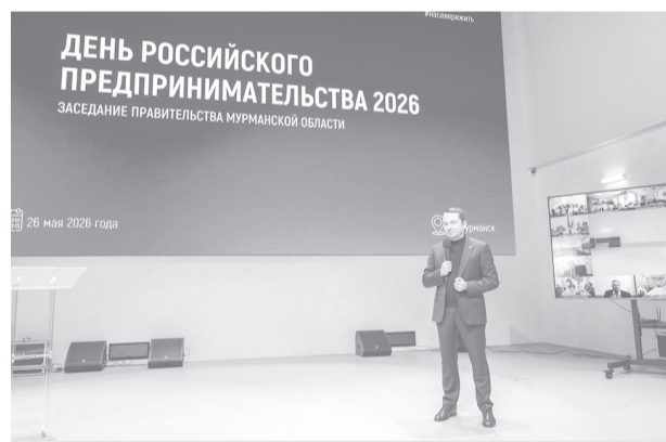
Андрей Чибис, губернатор Мурманской области

Он подчеркнул, что главная задача регионального правительства –