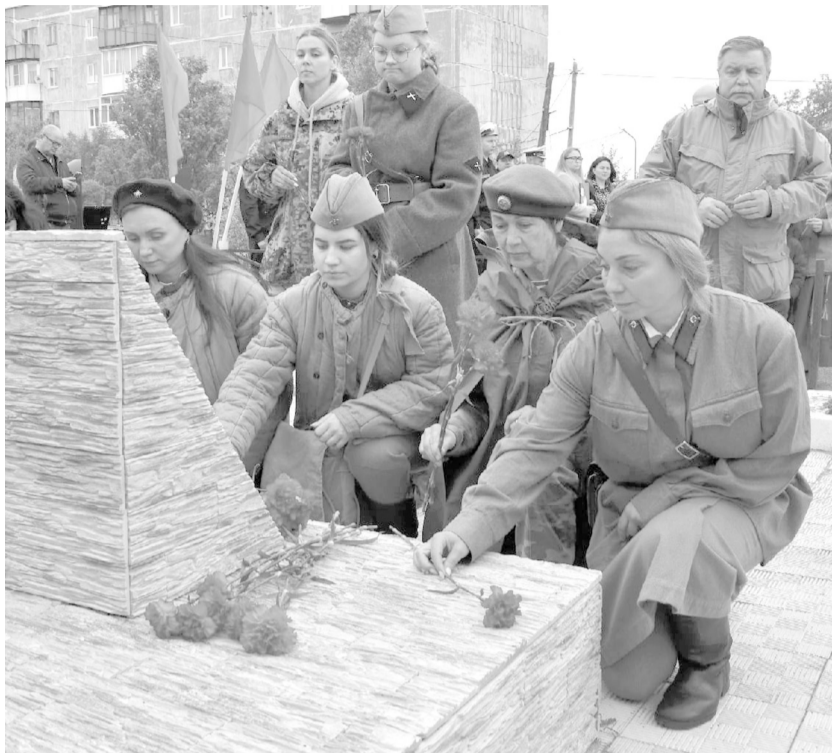
Наш корр. Фото из архива поискового отряда «Патриоты – наследники Победы».

Заочный этап конкурса «Доброволец года» Мурманской области прошли 58 участников: 35 заявок в номинации «Личные достижения» и 23 заявки в номинации «Добрая команда».