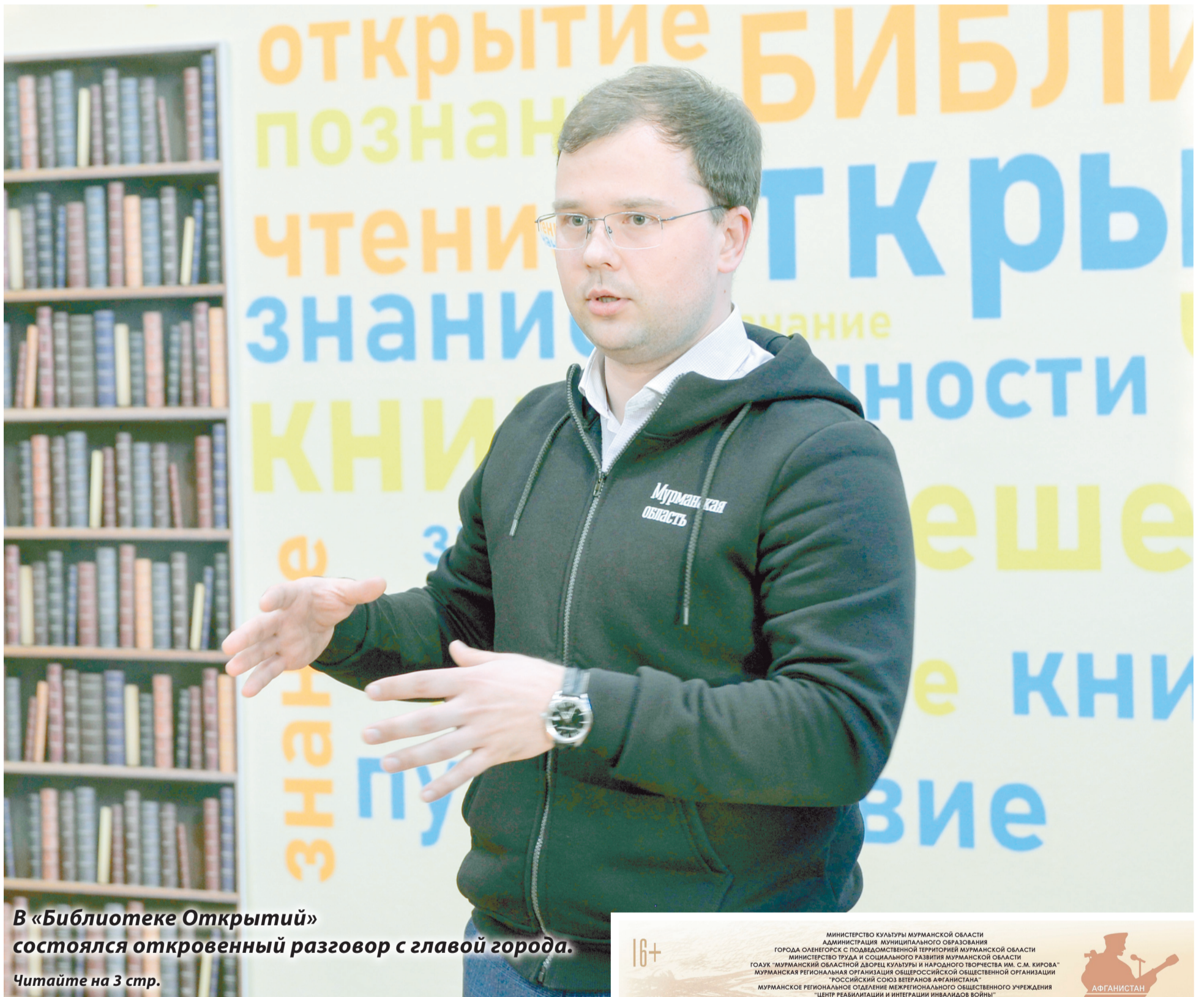
В «Библиотеке Открытий» состоялся откровенный разговор с главой города. Читайте на 3 стр.