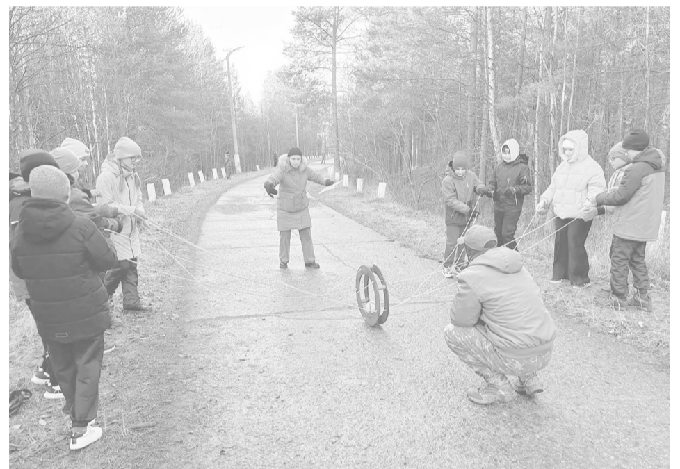
Фото участников школы № 13.