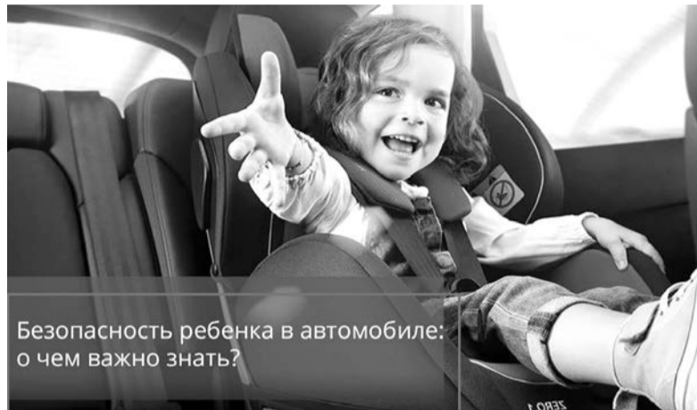
Безопасность ребенка в автомобиле: о чем важно знать?

При более серьезных последствиях для ребенка, которого оставили в машине допускается уголовная ответственность. Берегите детей.