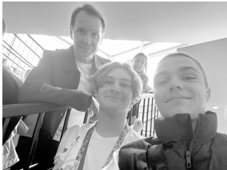
С актером театра и кино Евгением Мироновым.

Форуме – это уникальная возможность перенять знания и опыт у именитых деятелей культуры. С кем еще удалось встретиться или даже пообщаться?